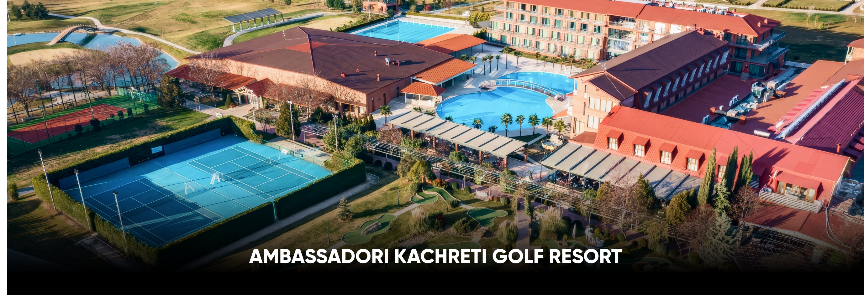
AMBASSADORI KACHRETI GOLF RESORT