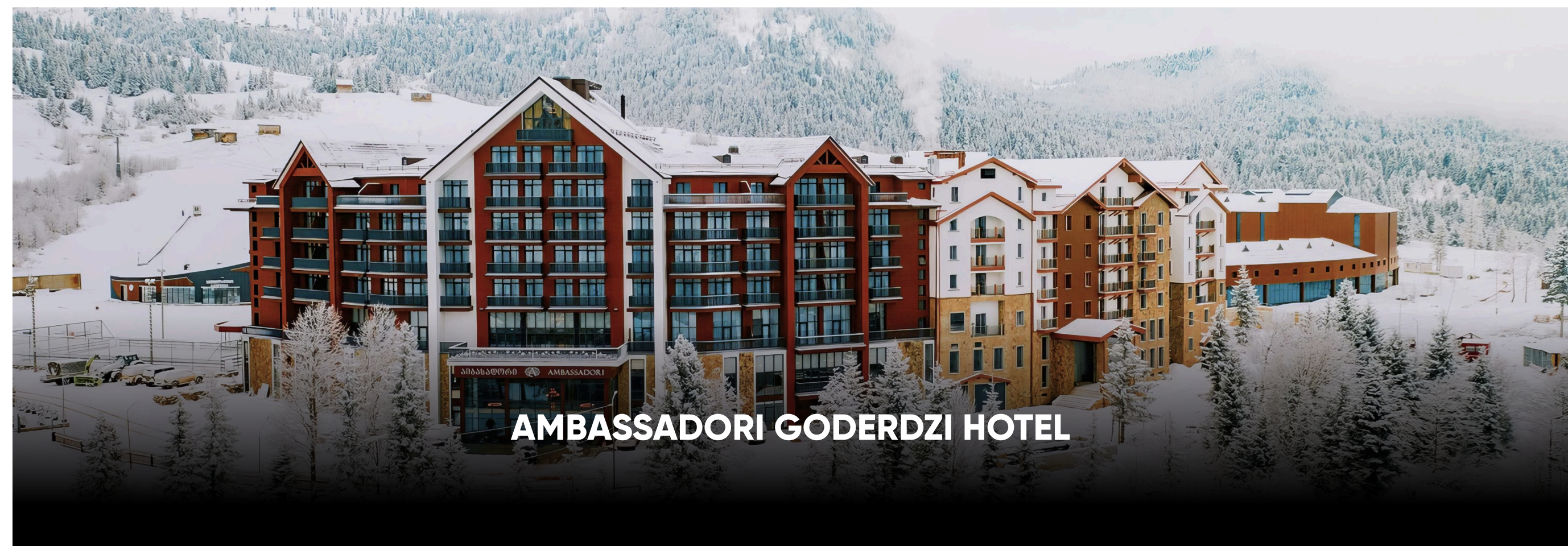
AMBASSADORI GODERDZI HOTEL