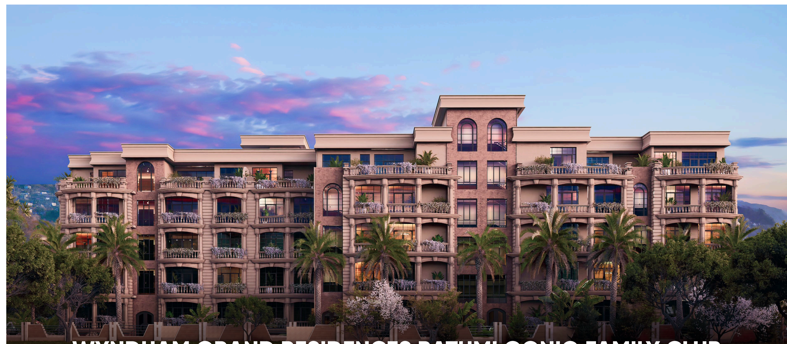
WYNDHAM GRAND RESIDENCES BATUMI GONIO FAMILY CLUB