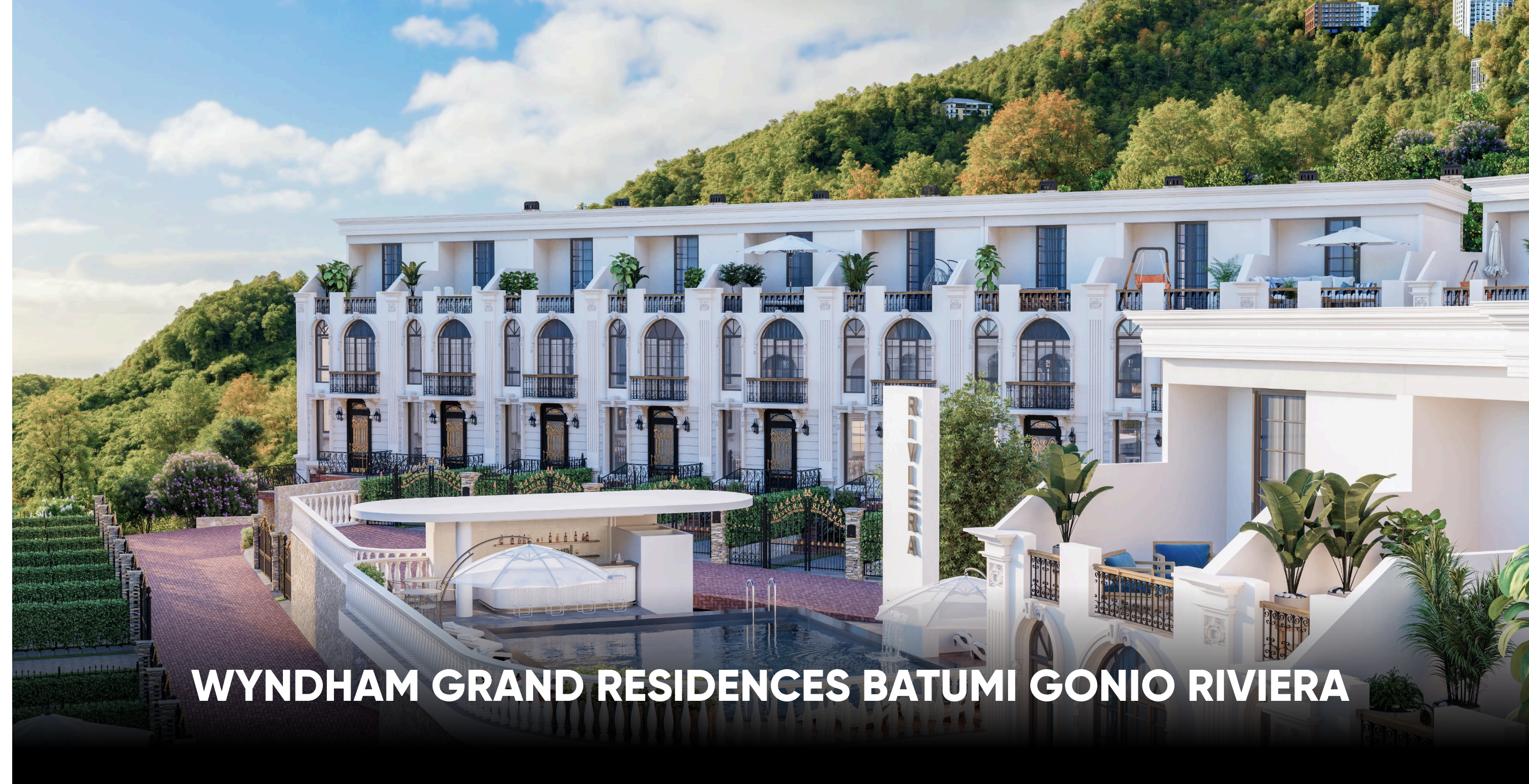
WYNDHAM GRAND RESIDENCES BATUMI GONIO RIVIERA