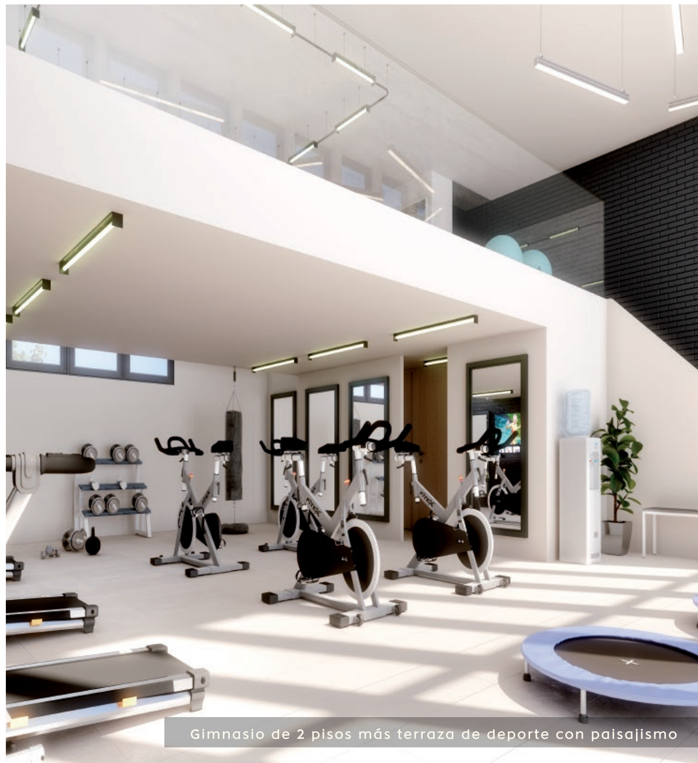
Gimnasio de 2 pisos más terraza de deporte con paisajismo

Más de 38 años de experiencia Inmobiliaria