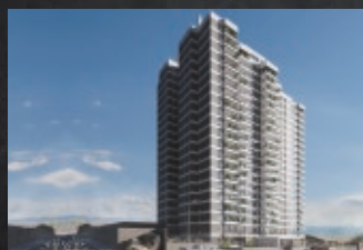
Roble - Plaza Costanera - Antofagasta