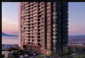
Las Águilas - Barrio Vistamar - Antofagasta

ALGUNOS PROYECTOS DESARROLLADOS EN ANTOFAGASTA