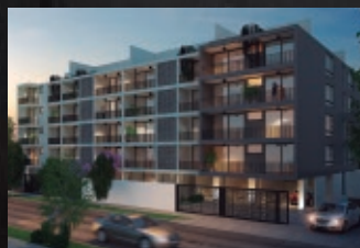
Pascual Baburizza 500 - Ñuñoa