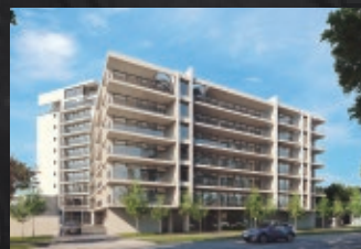
Los Leones 2537 - Providencia