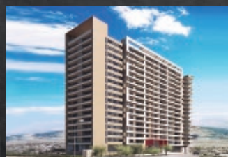
Las Torcazas - Barrio Vistamar - Antofagasta

ALGUNOS PROYECTOS DESARROLLADOS EN SANTIAGO