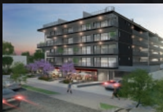
Manuel Montt 1453 - Providencia