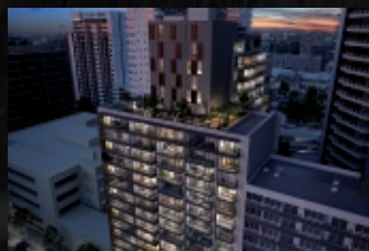
Link SM - Santiago

ALGUNOS PROYECTOS DESARROLLADOS EN SANTIAGO