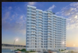
Maitén - Plaza Costanera - Antofagasta